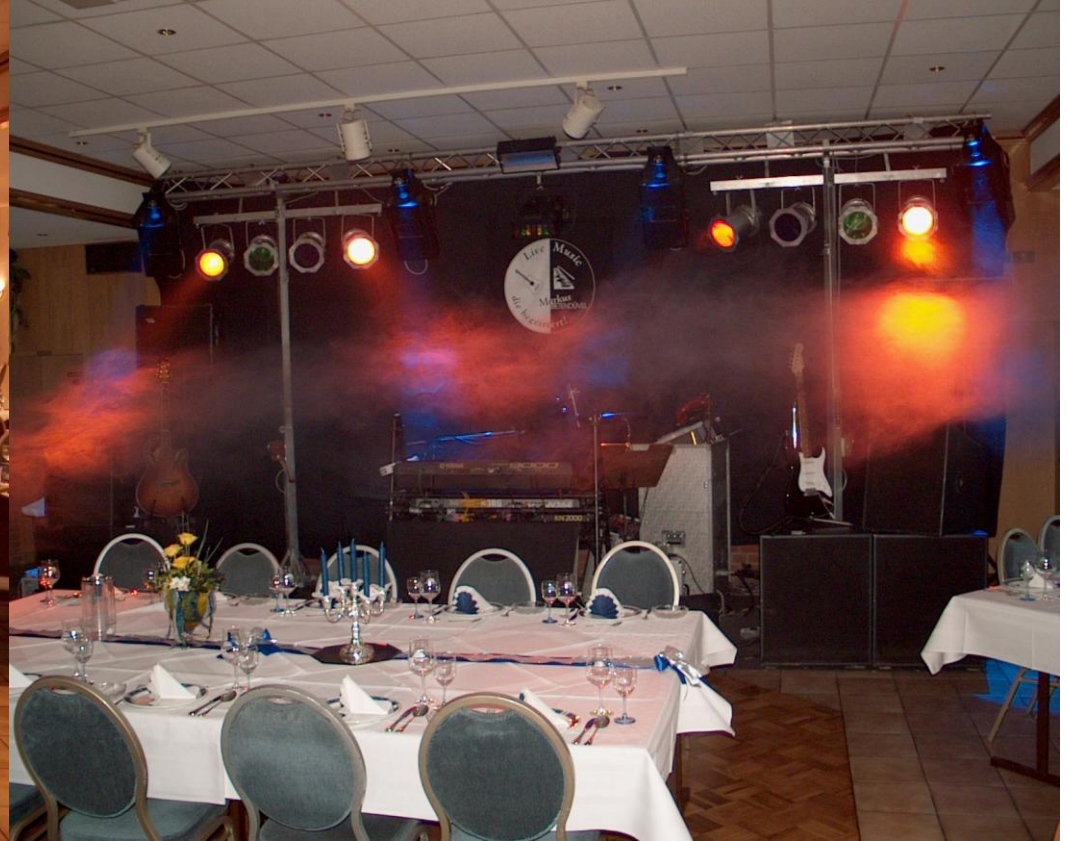
Aufbaubeispiel im festlich eingedeckten Saal des Hotel-Restaurant Bergeshöhe